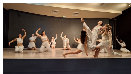
Alma Dance Company