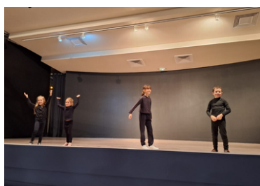
Les 6/8 ans