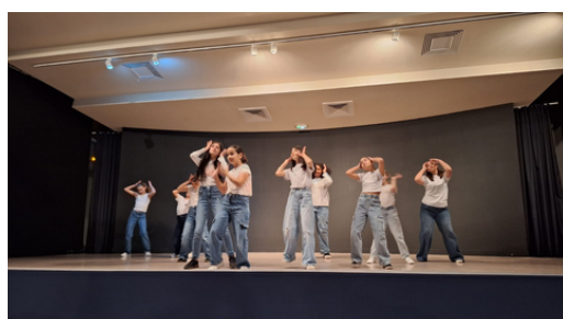
Les 9/12 ans